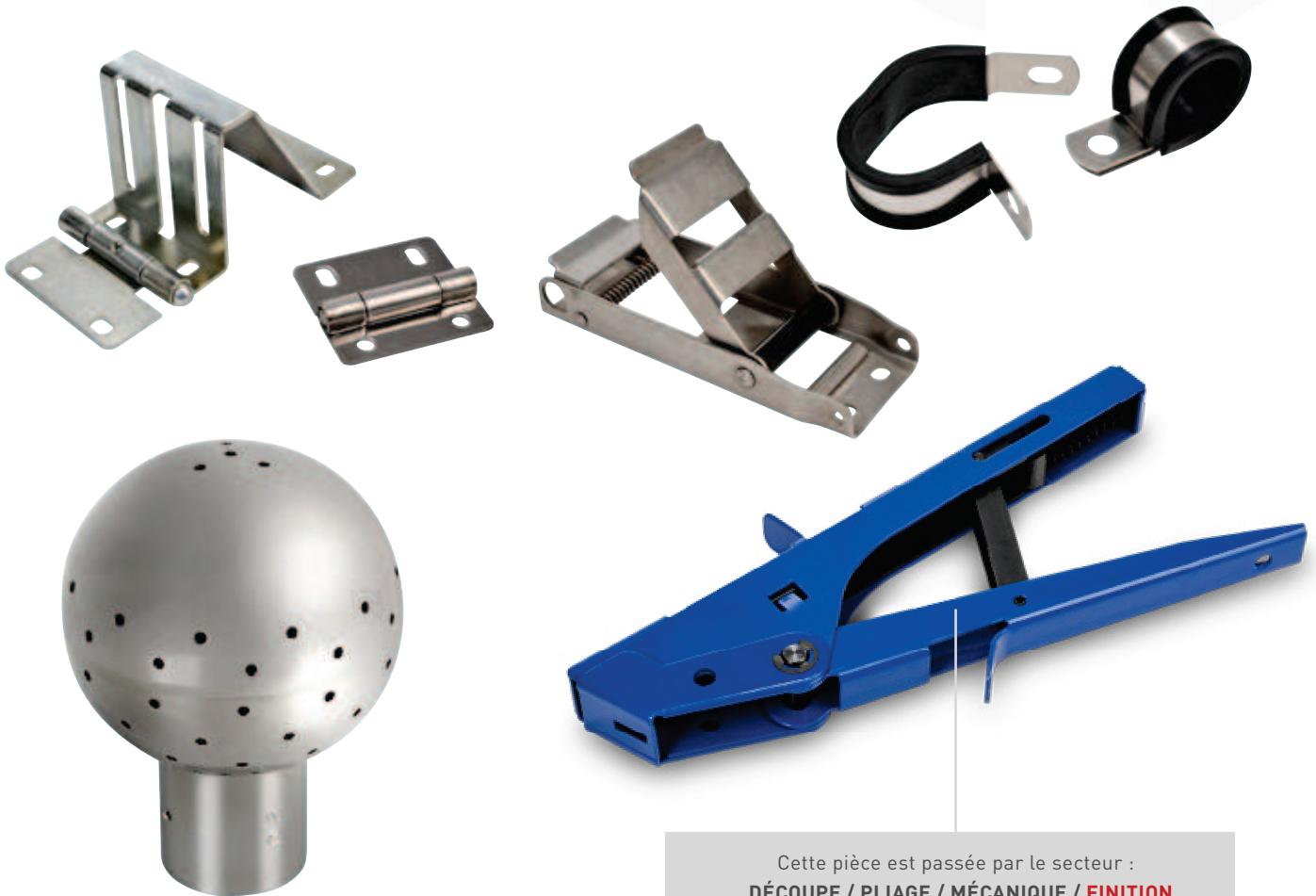
Cette pièce est passée par le secteur : DÉCOUPE / PLIAGE / MÉCANIQUE / FINITION